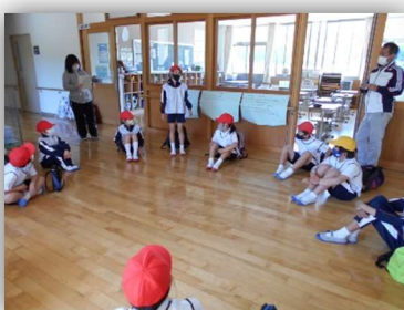
すこやかチーム結成式

とても楽しみにしていた校外学習。全校生で、ホテルと文化の里運動公園をめざしました。すこやかチームでウォークラリーをしながら歩きました。また、この日は1回目の「マイランチの日」でした。自分でお弁当を作る喜びを味わうとともに、食への興味関心がもてたことと思います。どの子もうれしそうにお弁当を食べていました。ご理解とご協力ありがとうございました。